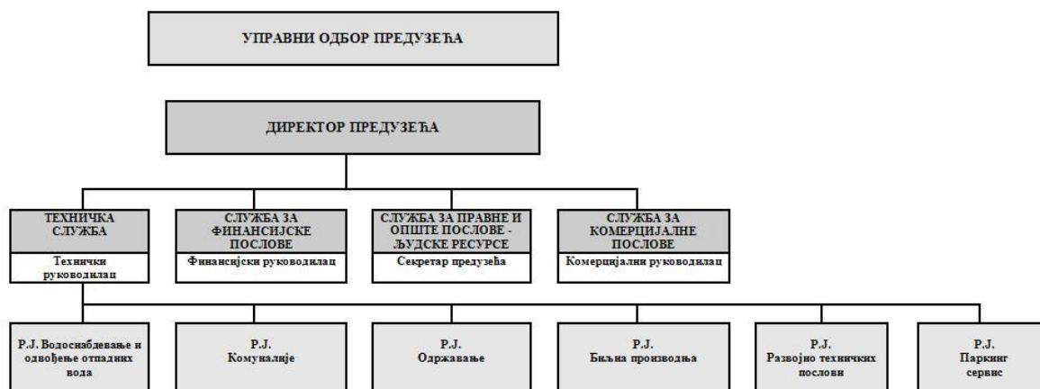
ОРГАНИЗАЦИОНА ШЕМА ЈКП "СТАНДАРД" КЊАЖЕВАЦ

Органи предузећа су: Надзорни одбор, Управни одбор и директор.